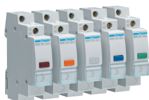
SVN122 SVN123 SVN125 SVN124 SVN121