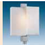
L 306 S