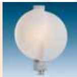
L 305 S