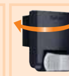
50° по горизонтали