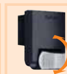
90° по вертикали