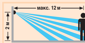
Надежный контроль благодаря защите от подкрадывания