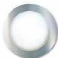
RS 10-11 L