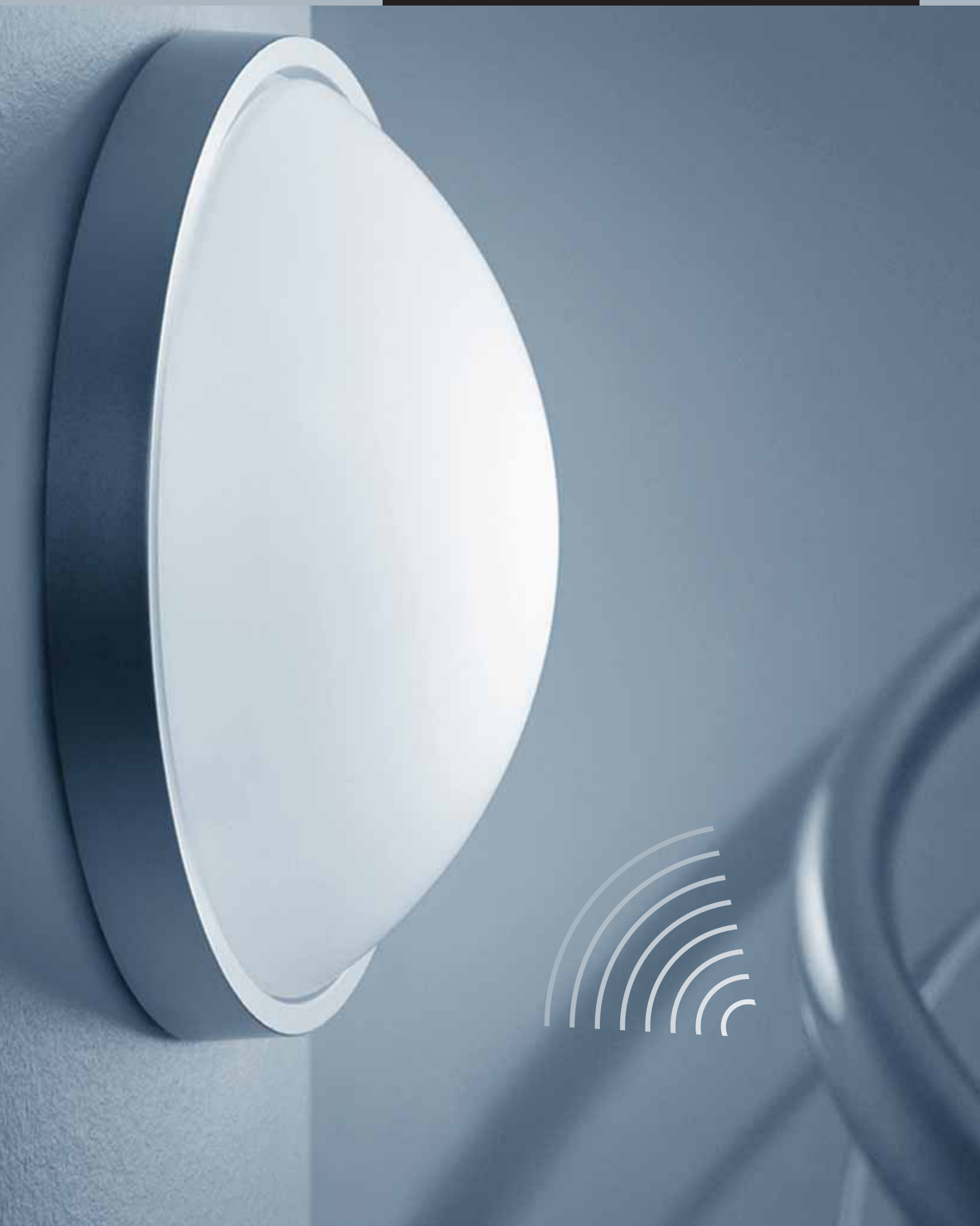
RS 10-4 L INOX