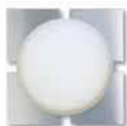
RS 10-6 L