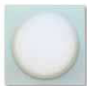
RS 10-5 L