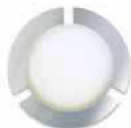
RS 10-9 L